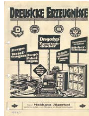
Einladung zur Leipziger Messe 1924