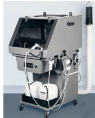
Reinigungsapparat für Kassen usw.