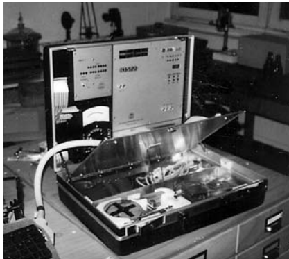
DST1 Diagnosegerät zur Fehlerdiagnose an elektronischen Schreibmaschinen

Die Branche war um diese Zeit mächtig in Bewegung: die mechanische Schreibmaschine erlebte noch eine letzte Blüte mit den Kugelschreibmaschinen – Dreusicke lieferte dazu die Spezialwerkzeuge für den Kundendienst – aber viel entscheidender noch war die Einführung der elektronischen Typenrad-Schreibmaschinen Ende der 70er Jahre, die immer mehr in Gebrauch kommenden Trockenkopierer, die Verbreitung der EDV in den Büros und Verwaltungen.