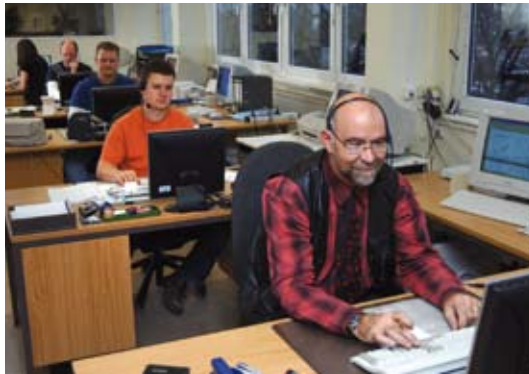
Callcenter und Expedition 2005

Die sprichwörtliche Redensart ‚Eulen nach Athen tragen = etwas Überflüssiges tun‘ gab die Anregung zum 1923 entstandenen Firmenzeichen ‚Drei Eulen‘. Gedankenverbindung: die Güte unserer Produkte, deren Preiswürdigkeit und die Kulanz unserer Firma verstehen sich von selbst.