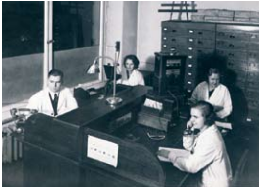
„Call Center“ für Ersatzteile 1939