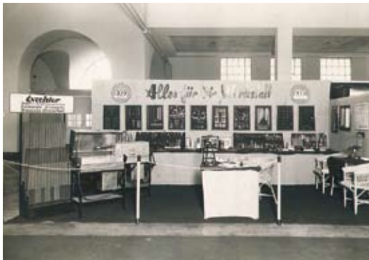
Stand auf der Leipziger Messe 1939