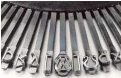
Zeichenänderungen auf Typenscheiben und Kugelhöfen